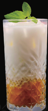
COCONUT MANGO FUSION