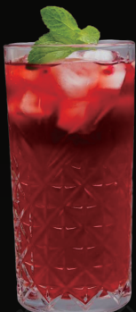
VERZY GRAPE VERY GRANATE