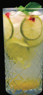
DUO LEMON PUNCH